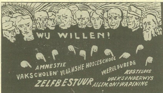
Daensistische pamflet waarin zowel flamingantische als antimilitaristische en sociale eisen worden geformuleerd (Drukkerij Daens, 1920). (DAVS)

In 1888, tijdens een vergadering van het pas opgerichte Vlaamsgezinde en katholieke studentengenootschap Rodenbach's Vrienden in Gent stelde Hector Plancquaert dat men dissidente lijsten moest durven indienen tegen de katholieke politici die onvoldoende aandacht besteedden aan het Vlaamse probleem. Een jaar later herhaalde hij zijn voorstel tijdens een massaal bijgewoonde Vlaamse landdag in Kortrijk. Hij wenste een werkelijk autonome politieke beweging, hield een hard requisitoir tegen het koninklijk hof en de kerkelijke en burgerlijke overheid, en verklaarde dat er hogere belangen op het spel stonden dan de eenheid van de katholieke partij. Ten slotte riep hij op tot het houden van massamanifestaties op de plaatsen waar op dat ogenblik verkiezingen werden voorbereid (onder andere Aalst en Dendermonde). De spreker werd luid toegejuicht, maar de katholieke pers schafte de toespraak af en enkele invloedrijke leden van de Landdagbeweging vroegen om de dissidente lijsten en de betogingen voorlopig achterwege te laten. Het laatste gebeurde, niet het eerste.