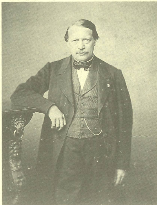
De autodidact Hendrik Conscience besloot onder invloed van de romantiek en de kring rond De Olijftak in het Nederlands te publiceren.