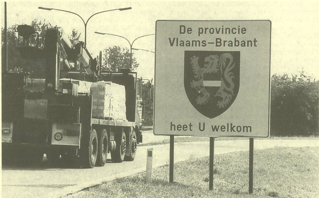
Met de vierde staats hervorming van 1992-1993 ontstond de provincie Vlaams-Brabant (1 januari 1995), met inbegrip van een eigen gouverneur, bestendige deputatie, provincieraad en administratie.