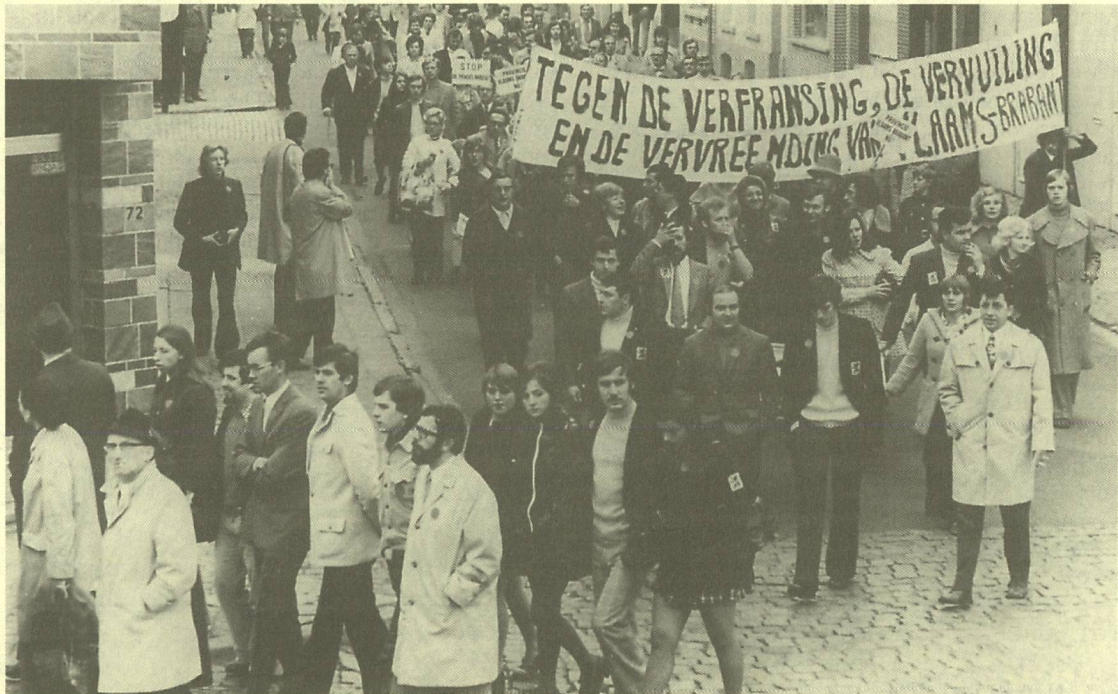
Vilvoorde 15 oktober 1972: betoging van de VVB. Het spandoek vat de doelstelling van de demonstranten mooi samen.