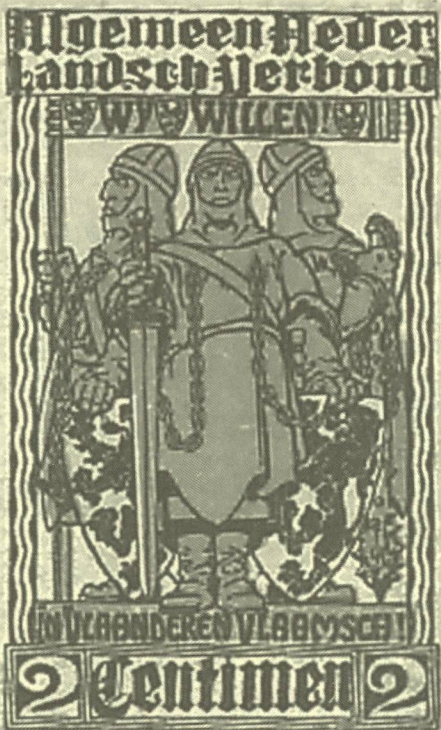
Zegel uitgegeven door het ANZ ter ondersteuning van de actie "In Vlaanderen Vlaamsch" (z.j.). (AMVS)

De bevordering van de Nederlandse taal – bij de oprichting van het Verbond een nationalistisch doel, maar nu bedoeld als het zich richten op het gemeenschappelijk cultureel erfgoed – kreeg voortaan de hoogste prioriteit.