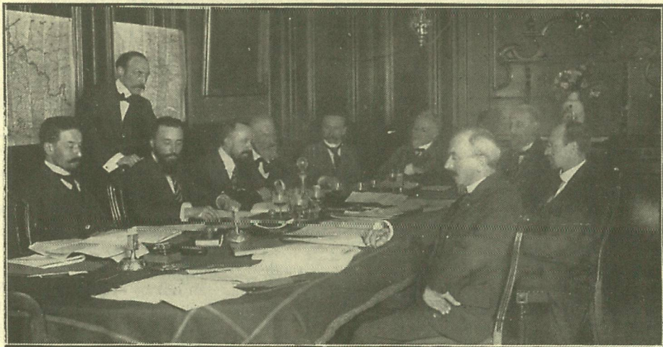
De Commissie van Gevolmachtigden van den Raad van Vlaanderen.

Sedert de stichting van den Raad van Vlaanderen, waarvan de leden onder de trouwste en wakkerste leiders van 't Vlaamsche volk door aanduiding van de bewuste menschen verkozen werden, is er door dit beraadslagend lichaam hoogst heilzaam werk verricht, waarvan een buitenstaander misschien niet zoo rechtstreeks als een ingewijde de draagkracht beseft.