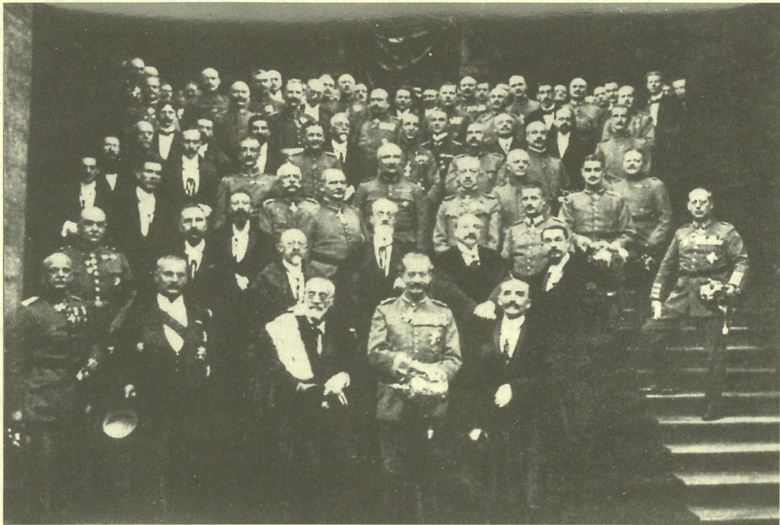
21 oktober 1916: de Duitse gouverneur-generaal Moritz von Bissing draagt de Vlaamsche Hoogeschool plechtig over aan het hooglerarenkorps. Voor de Duitse bezetter was de vernederlandsing van de Gentse universiteit een onderdeel van de Flamenpolitiek; voor de activisten betekende het de langverhoopte realisatie van een belangrijk punt op de agenda van de vooroorlogse V.B.