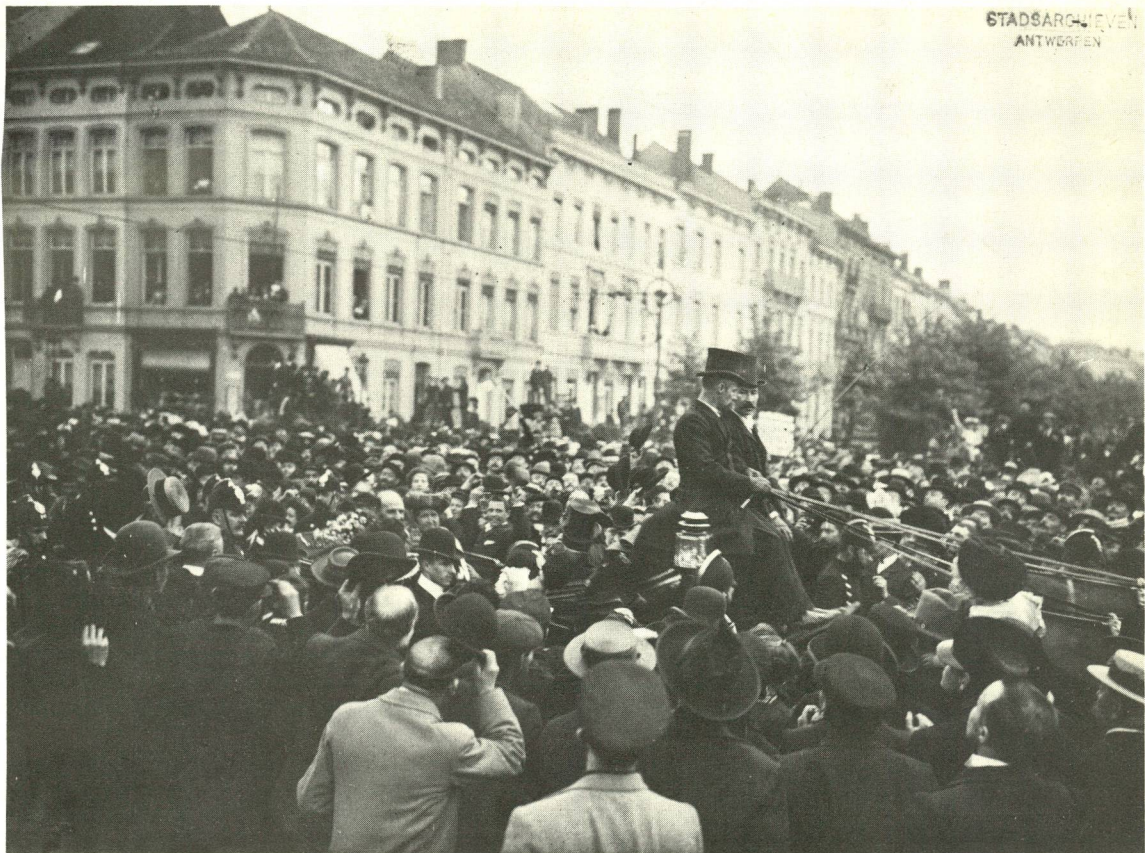
Bezoek van de Boerengeneraals L. Botha, J. de la Rey en C. de Wet te Antwerpen (19 september 1902).