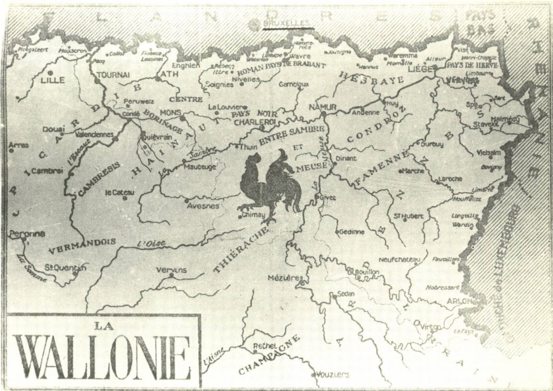
Landkaart van Wallonië. door het Institut I. Destrée verspreid als wenskaart