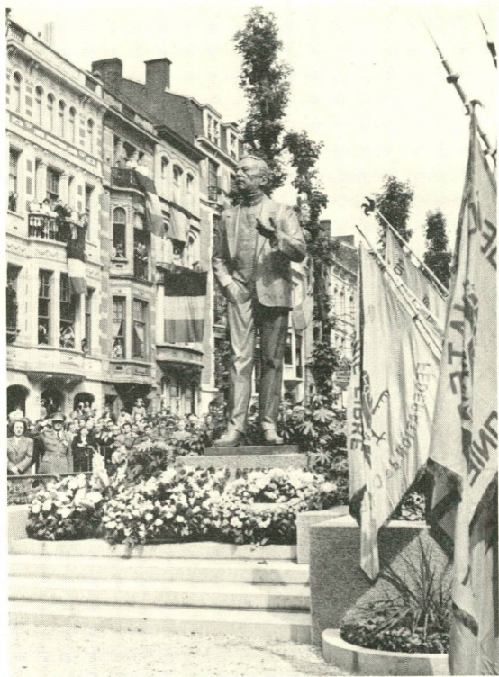
Onthulling van het monument van Jules Destrée te Charleroi door minister L. Collard in aanwezigheid van koning Boudewijn (1957).

Het is duidelijk dat Destrée's inzet op dat ogenblik de wallingantische grieven tot een programmatisch geheel vermocht samen te ballen. Op de assmblée te Charleroi van 16 maart 1913 kreeg de Rode Haan met tricolore das op gele achtergrond voor de wallinganten dezelfde betekenis als de Vlaamse Leeuw voor de flaminganten. Destrée's evangelie mondde uit in het wallingantisch devies: Wallons toujours, dat verkozen werd boven het ontactische Français ne puis, Flamand ne veut, Wallon demeure. Daar elke Waalse streek er een eigen hymne op nahield, kon er op dat punt geen Waalse overeenkomst bereikt worden. Als gemeenschappelijk lied was de Marseillaise altijd ter beschikking.