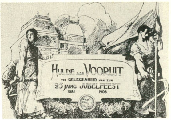
Album uitgegeven bij het 25-jarig bestaan van Vooruit

raden moesten plaatshebben, kwam Anseele (z. aldaar), die ook aan het tweede weekblad had meegewerkt, voor de dag met plannen voor een goedkoop dagblad, een zg. centenblad, dat de socialistische kandidaten zou steunen. Om deze plannen door te drukken stelde hij voor, dat het blad slechts drie maanden zou verschijnen, tot na de verkiezingen. De coöperatie Vooruit (ontstaan uit een „samenwerkende bakkerij”) abonneerde al haar leden gratis voor één maand. Het dagblad kreeg dezelfde titel en het eerste nummer verscheen op 31 augustus 1884 in 15.000 exemplaren. Anseele werd hoofdredacteur, schreef het roman-feuilleton, trad op als letterzetter en ging mee het blad verkopen. Op 3 november 1884 werd beslist, de krant te laten voortbestaan, hoewel ze verlies boekte. De financiën kwamen van de coöperatie en van de „strijdpenning”, waarvoor de leden en lezers geld bijeenbrachten.