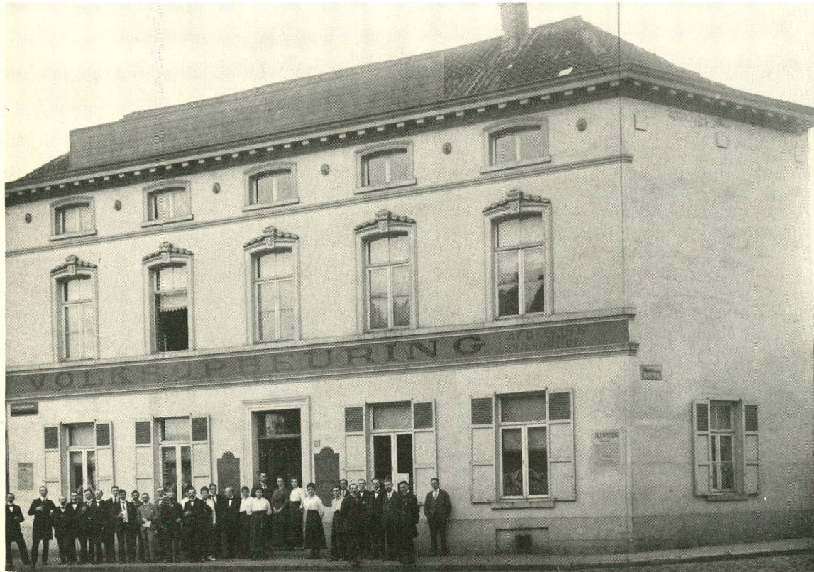
Inhuldiging van het nieuw lokaal van Volksopbeuring te Vilvoorde (15 mei 1918)