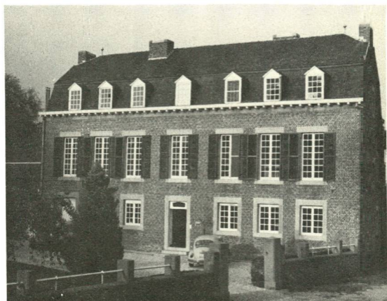
Het cultureel centrum Veltmanshuis te Sint-Martensvoeren.

Het parochie- en verenigingsleven was in de Voerstreek altijd Vlaams, tot op heden. Het onderwijs werd er steeds gegeven in het Nederlands. Daar kwam pas enige verandering in, toen het schoolhoofd van Remersdaal in 1953 de tweede graad van zijn lagere school verfranst. Van september 1963 af werd echter een grootscheepse campagne in de hele Voerstreek op touw gezet om er de jeugd te verfransen via het kleuter- en lager onderwijs. Dit gebeurde als reactie op het goedkeuren van de taalgrenswet van 8 november 1962 die de Voerstreek bij de provincie Limburg voegde. In tegen-