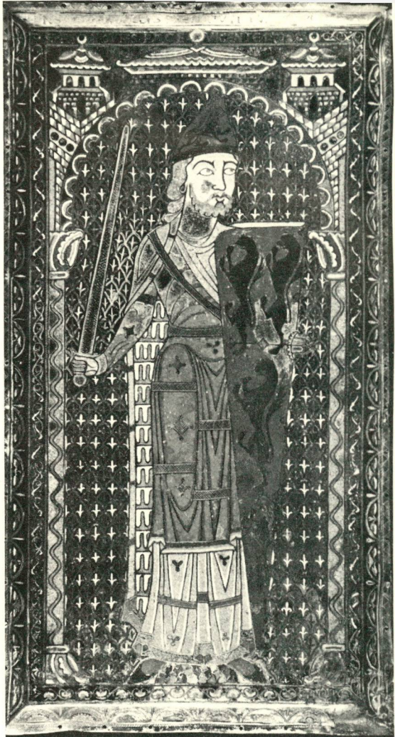
Grafsteen van Geoffroy Plantagenet, overleden in 1150 (Museum van Le Mans).

„een veld van goud met een klauwende leeuw van sabel”, alhoewel heraldisch verantwoord, meer als een partijsymbool beschouwd moet worden. Daarnaast werd vooropgezet, dat beide leeuwen (zowel die met als die zonder rode tong en klauwen) Vlaamse leeuwen zijn. Maar de overgrote meerderheid (10 van de 12) was van mening, „dat moest gestreefd worden naar een algemene consensus opdat het embleem dat van de hele Vlaamse gemeenschap zou zijn”. Op 22 mei 1973 werd met 95 stemmen tegen 29 bij 2 onthoudingen een decreet aangenomen, waarvan art. 2 luidt : „De Nederlandse Cultuurgemeenschap heeft als vlag : in goud een leeuw van sabel, geklauwd en getongd van keel”. Van de koninklijke handtekening voorzien op 6 juli 1973 verscheen het „Decreet tot instelling van een eigen vlag, een eigen volkslied en een eigen feestdag van de Nederlandse Cultuurgemeenschap” in het Belgisch Staatsblad van 12 september 1973.