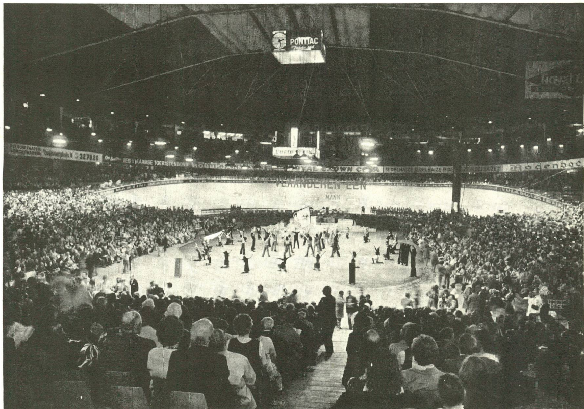
Vlaams Nationaal Zangfeest van 1961.