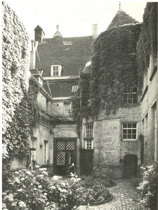
Het oud conservatorium aan de Sint-Jacobsmarkt te Antwerpen.