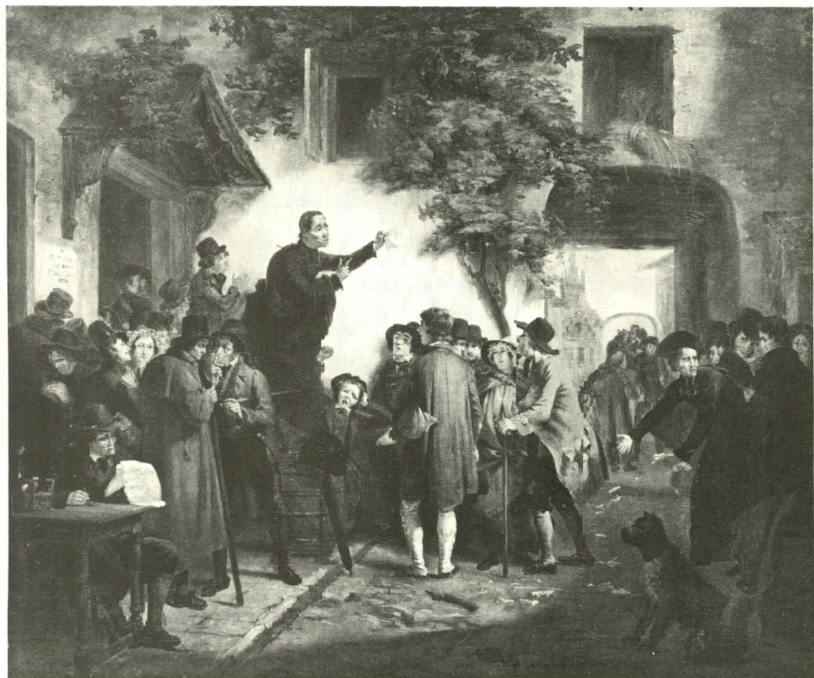
Scintlaerij door J. Geirnaert : De verkiezingsstrijd voor de herberg (Gent, 1831).