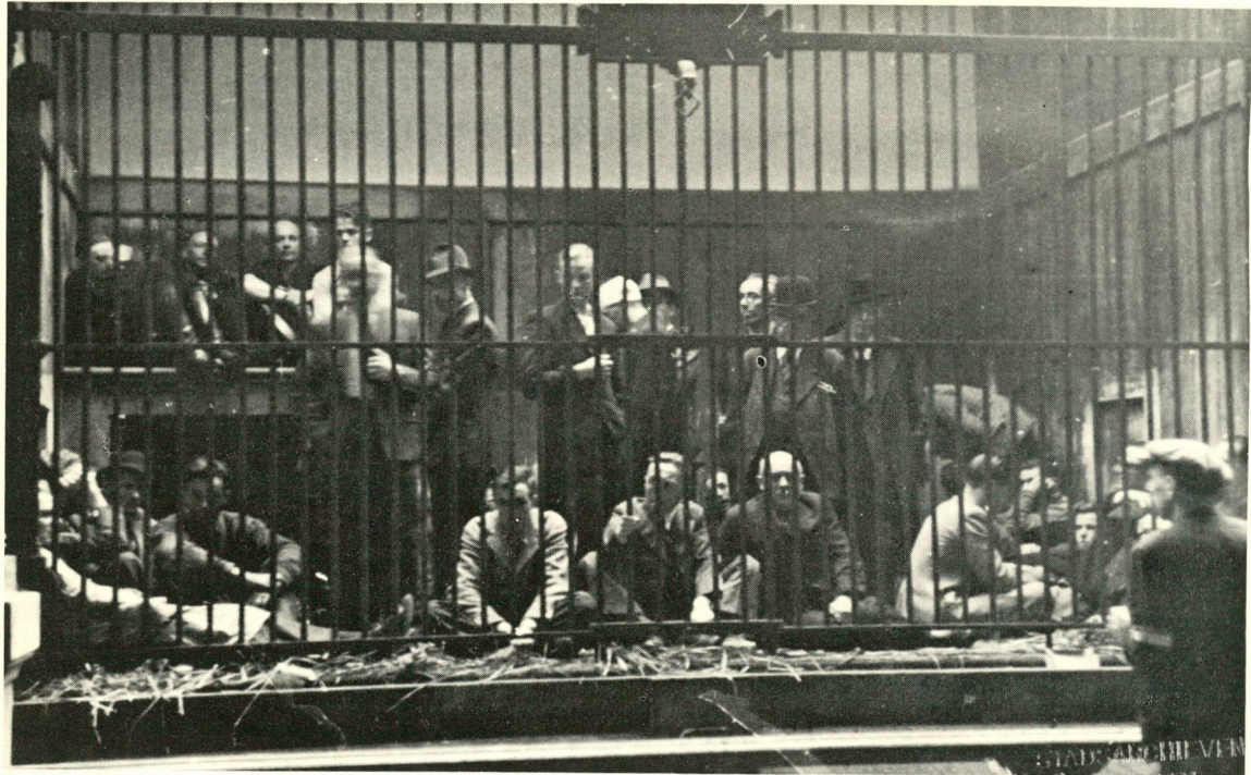
Repressieslachtoffers opgesloten in de leeuwenkooi van de Antwerpse dierentuin (september 1944).