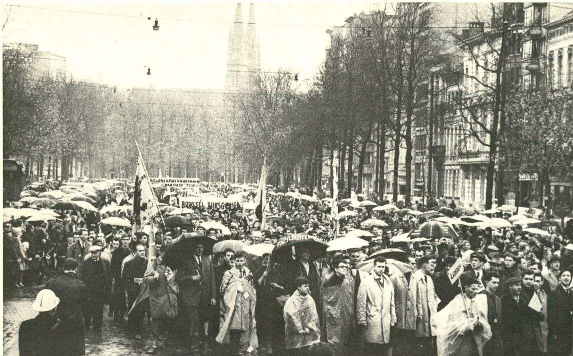
Betoging van het Vlaams Aktiekomitee te Antwerpen op 10 november 1963 na de Vlaamse nederlaag te Hertoginnedal. De manifestanten eisten federalistische staatshervormingen en economische structuurhervormingen.