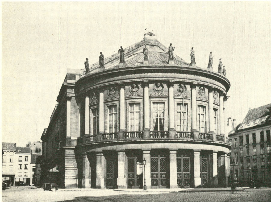
Het Théâtre Royal, door F.B. Bourla, sinds 1934 Koninklijke Nederlandse Schouwburg.