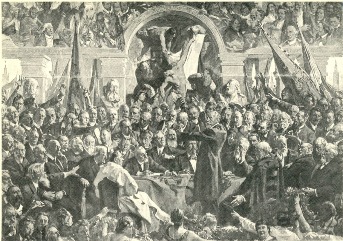
Het Gulden Doek van Vlaanderen door H. Luyten.