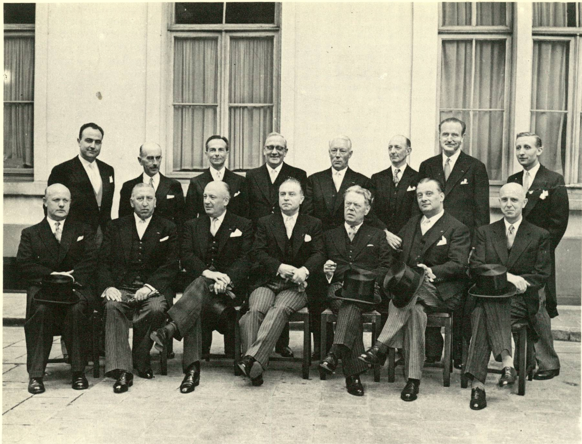
Regering Eyskens (23 juni - 4 november 1958). Zittend (van links naar rechts):

A. Dequae, P.W. Segers, J. van Houtte, G. Eyskens, A. de Vleeschauwer, P. Wigny, P. Harmel;