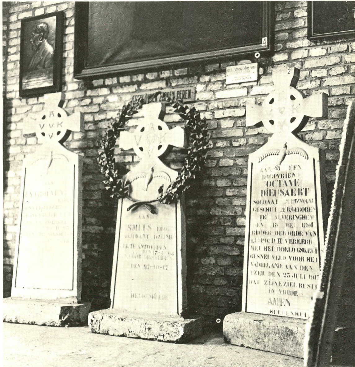
Heldenhuldezerkjes bij de vroegere IJzertoren.