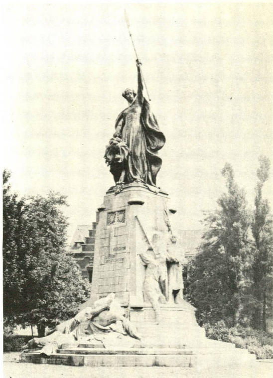
Groeningemonument te Kortrijk.