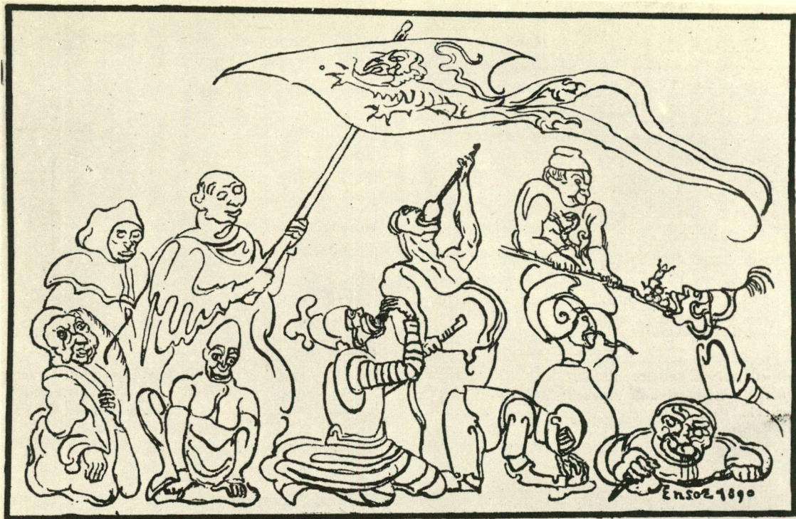
« Vóór de strijd aanving, knielden de Vlamingen en namen een weinig van de gellefde moederaarde in den mond... » (Humoristische voorstelling door JAMES ENSOR.)