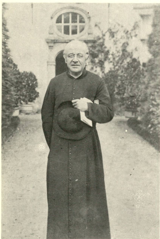
G. Gezelle in 1898.

stichtend lid van de Koninklijke Vlaamse Academie, op 6 mei 1887 doctor honoris causa aan de universiteit te Leuven; daarna ontving hij nog enkele ridderorden. Van mei 1889 tot september '93 was hij rector van de Franse zusters van het Kindje Jezus, een sinecure waardoor hij in staat was zich te wijden aan zijn studie en poëzie. Toen de zusters in 1893 naar Frankrijk terugkeerden, bleef hij zonder enige officiële functie, tot hij op 30 maart 1899 werd benoemd tot rector van de Engelse Kanunnikessen van Lateranen te Brugge, aan welke functie een kanonikaat was verbonden. Voor hij echter kanunnik werd, stierf Gezelle in het Brugse Klooster op 27 november 1899.