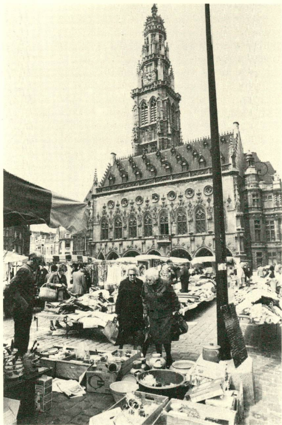
Groie Markt te Atrecht (Arras).