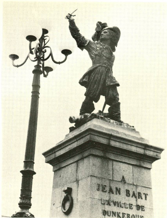
Standbeeld te Duinkerke van de Vlaamse kaper Jan Baert (1651-1702) in dienst van Lodewijk XIV.