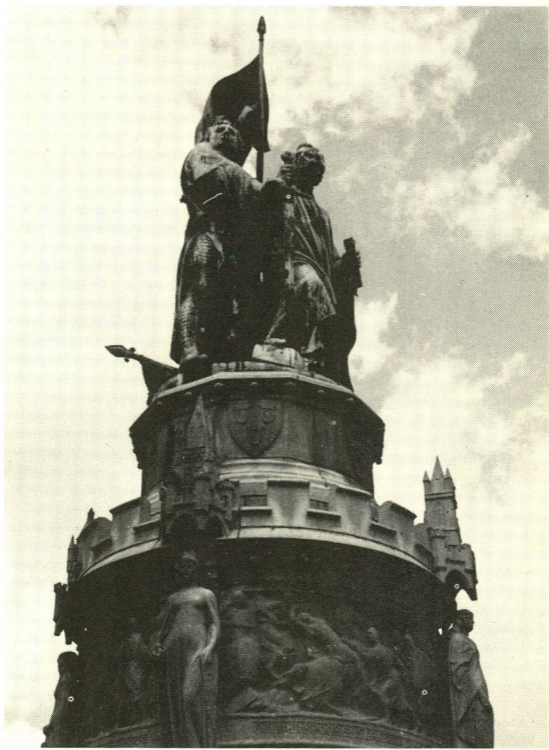
Breidel en De Coninck door P. de Vigne (1886).

heid van de twee figuren is fel geredetwist. Dr. R. van Roosbroeck schreef in 1941: „Zoo sterk was de traditie, de nationale legende haast, rond die XIV e -eeuwse helden geweven, dat men begon te twifelen over de werkelijkheid van hun bestaan. De legende was ten slotte sterker geworden dan de werkelijkheid.” Daarna brengt dezelfde historicus zoveel vaststaande gegevens aan, dat de werkelijkheid de legende overschaduwet.