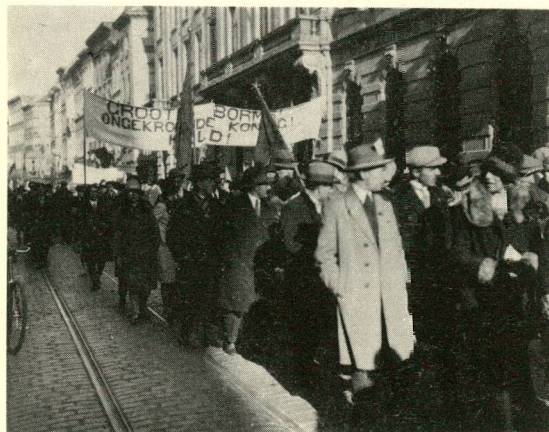
Bormshulde te Antwerpen na diens vrijlating (3 februari 1929).

Eind november 1917 werd Borms benoemd tot lid van het Persbureau van de Raad van Vlaanderen. Op de rumoerige vergadering van 22 december 1917 werd op voorstel van Borms de zelfstandigheid van Vlaanderen uitgeroepen. De Duitsers namen dit niet, dwongen de Raad tot ontslag en tot verkiezingen voor een tweede Raad van Vlaanderen. Deze volksvergaderingen hadden plaats in verscheidene steden van het Vlaamse land in de maanden februari-maart 1918. Op 17 januari 1918 werd Borms in de pas opgerichte commissie van Gevolmachtigden benoemd tot Gevolmachtigde voor Nationaal Verweer. De Gevolmachtigden beschouwden zich als ministers van de Staat Vlaanderen en hadden elk hun eigen commissie, zoals de ministers hun departement hebben. Op 8 januari 1918 werd Borms door het Belgisch gerecht gearresteerd op grond van de Belgische besluitwetten, door de regering in Le Havre uitgevaardigd tegen de activisten. Door tussenkomst van de bezetter werd hij echter vrijgelaten nog voor de procedure begonnen was. Het wantrouwen in de Raad van Vlaanderen tegenover de Duitsers en de Gevolmachtigden steeg, omdat de Gevolmachtigden nog steeds steunden op de vage beloften van de Duitsers. De Raad voelde zich te zeer gebonden aan de bezettende macht en protesteerde. Dit leidde tot het ontslag van de Gevolmachtigden in augustus 1918 en de afschaffing van de Raad, die nog officieus verga-