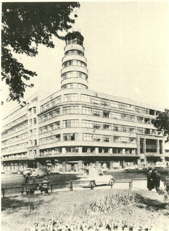
Oud BRT-gebouw aan het Eug. Flageyplein.