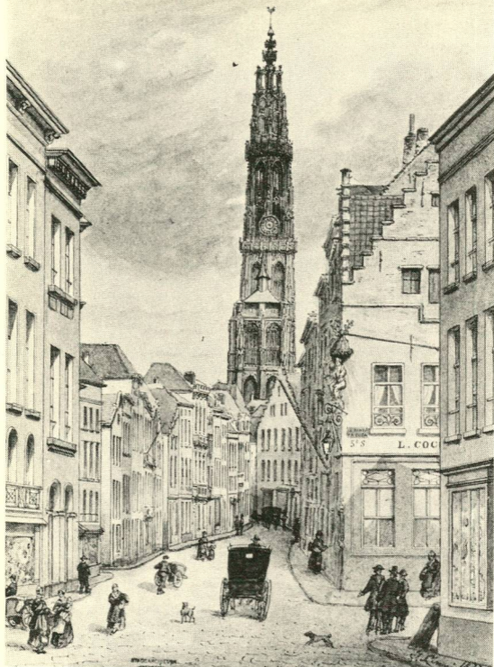
Kammenstraat door J. Linnig (1873).

wen van Het Handelsblad had gemunt. Ondanks de politieke tegenstellingen werd met eensgezindheid de eerste wereldtentoonstelling (1885) georganiseerd, die ook de eerste in België zou zijn. Tijdens deze wereldtentoonstelling werd te Antwerpen een congres gehouden van 68 arbeidersorganisaties. Het programma en de statuten van de Belgische Arbeiderspartij werden er uitgewerkt (15-16 augustus 1885).