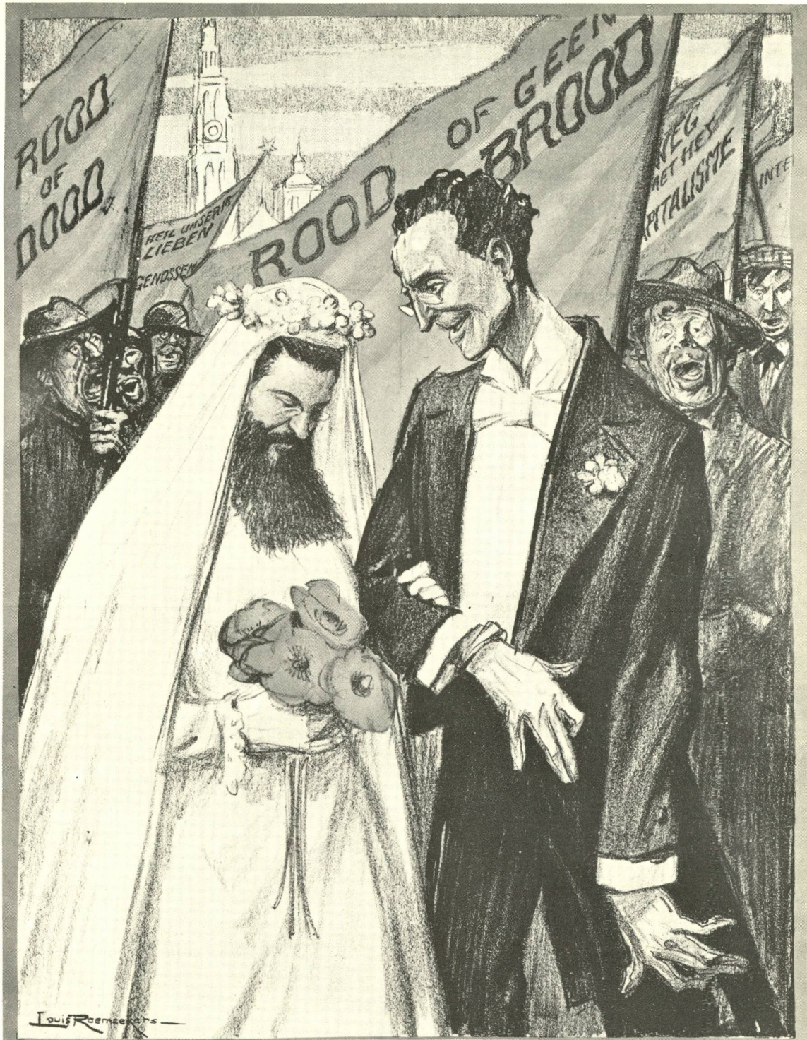
Wetgevende Verkiezingen van 20 November 1921

Het Socialo-Clericaal Huwelijk van Antwerpen M r en Mev. Huysmans-Van Cauwelaert Het Land zal AL de demagogen veroordeelen en stemmen voor de LIBERALE PARTIJ