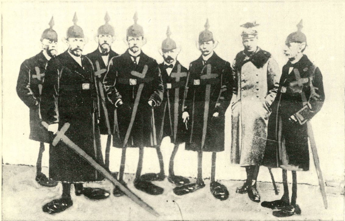
Die Blamen, eine Abordnung des Rates für Flandern, die vom Reichskanzler empfangen wurden.

Bei dem Einzuge der Blamen wurde ihnen von Reichskanzler v. Bismarck, nach auch dem Besuche des Rates für Flandern eine Lesung der Kaiserproklamation im Belgischen Palais erfolgt, und zwar unter dem Befehle des belgischen Vize-Königs eine Begrüßung von Blamen in Brüssel und eine von Balenien in Roubaix ertheilt wird.