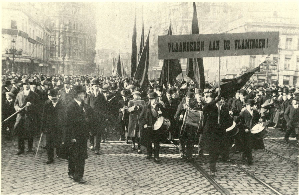
Activistische betoging te Antwerpen (3 februari 1918).