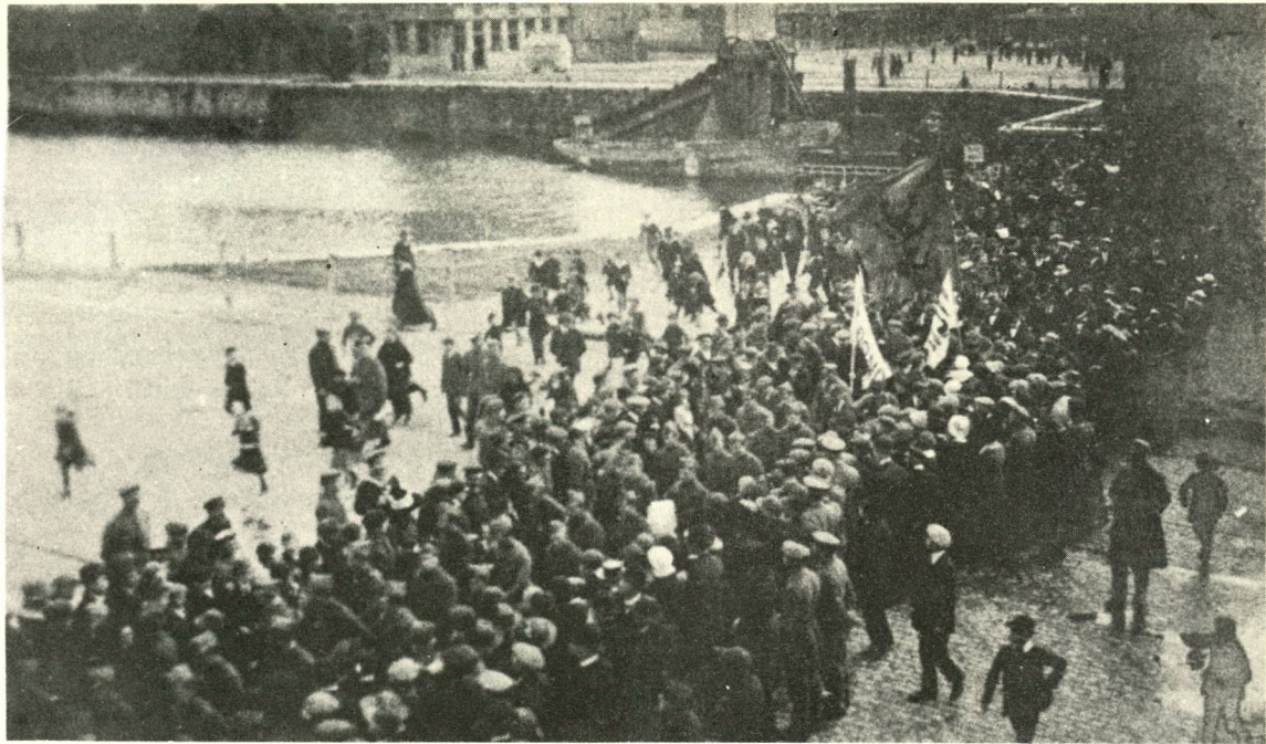
Activistische betoging te Oostende (15 september 1918).